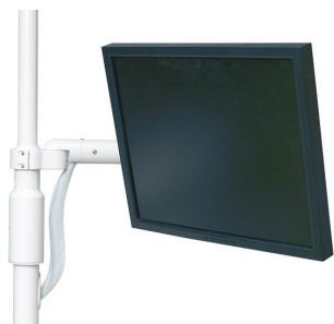
Portamonitor con braccio

Il portamonitor opzionale può essere posizionato facilmente verso il paziente per consultazione ed educazione o spostato da parte quando non utilizzato.