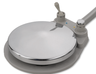
Pedaliera a disco con chip air

Controllo intuitivo, come lo vuoi tu. È possibile scegliere tra una pedaliera a disco con chip air o a leva per una modulazione precisa di manipoli elettrici e turbine.