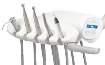
A-dec 300 Traditional