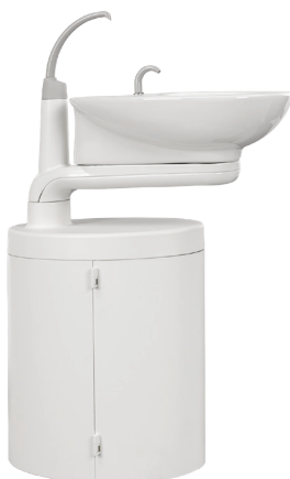
Bacinella e centro di supporto

La bacinella in porcellana opzionale ruota per facilitarne l'utilizzo da parte del paziente e include un serbatoio da due litri per una generosa erogazione di acqua. Il centro di supporto può contenere separatore di amalgama, sistemi di aspirazione o altri accessori.