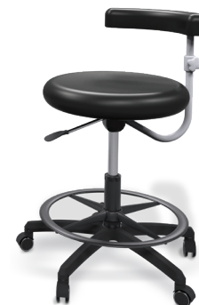
Seggiolino assistente Performer eVo