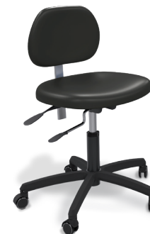
Seggiolino operatore Performer eVo

Robustezza iconica e supporto ergonomico. Uno schienale anatomico, il supporto busto regolabile, i bordi arrotondati e l'inclinazione ergonomica della seduta aiutano a ridurre la pressione sui dischi intervertebrali e i dolori muscolari.