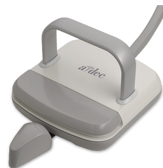
Pedaliera comando strumenti a leva