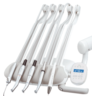
A-dec 300 Continental

Compatta e facile da posizionare, ti permette di avere tutto ciò di cui hai bisogno a portata di mano. Disponibile nei design Continental® o Traditional, così da rispondere alle esigenze del tuo studio.