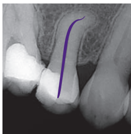
Difficoltà: doppia curvatura