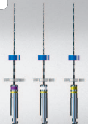
ISO 10/02 ISO 15/02 ISO 20/02