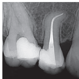
Dopo l'intervento Preparazione: 35/.04