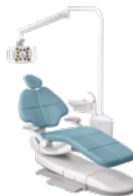
Montaggio a poltrona