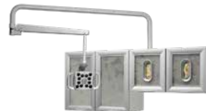
Montaggio a parete/su mobili