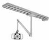
Montaggio su binario

Non tutte le opzioni disponibili. Consultate il distributore.